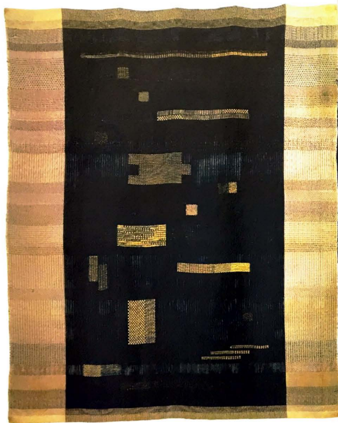
© 2018 The Josef and Anni Albers Foundation

Progettata dal designer Ziad Alonaizy per Lamberti, Aegis fa parte di una collezione che comprende anche side table e specchio. lambertidesign.it e alonaizy.com